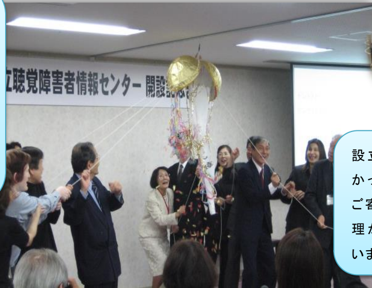
平成 17 年 5 月 9 日センター開設記念式典

開所以来、皆さまからの ご要望をもとに様々なイベントを開催してきました。全てをご紹介できないのが残念ですが、これからも多くの人が集い、笑顔になれるセンターを目指します。