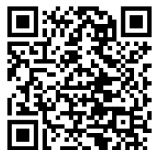
[申込専用フォーム]

TEL (078)362-3237 FAX (078)362-9040 メール universal@pref.hyogo.lg.jp