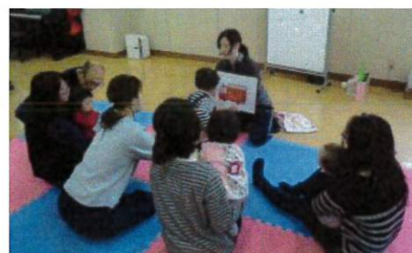
0歳児と保護者の集団教室 (保護者同士が知り合う機会にもなっています。)