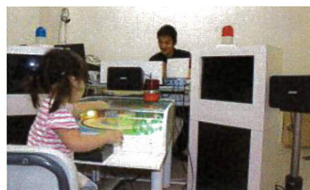
聴覚特別支援学校における聴力測定