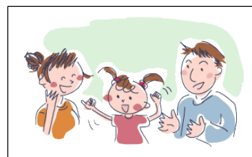
「聴覚障害」の理解セミナー

QRコード、もしくはFAXで 兵庫県立聴覚障害者情報センターまでお申し込みください。