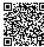
(小野市) 申込サイト