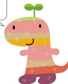
丹波竜のちーたん